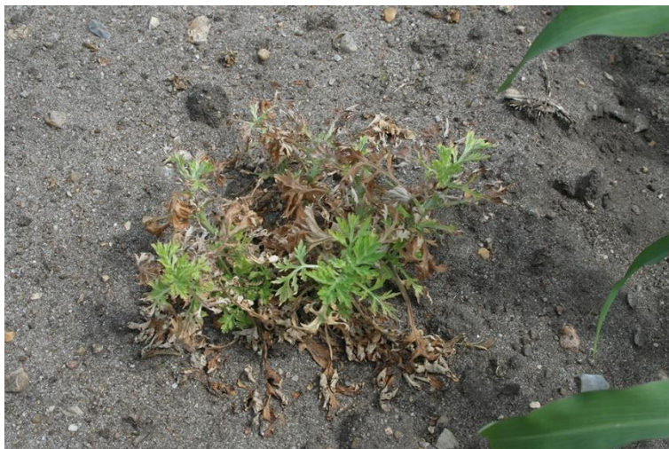
BILLEDE 3. EN TREDELT SPRØJTNING MED CALLISTO HAR GOD EFFEKT MOD GRÅ BYNKE.

I anden radrensning skal der mere fart på, så gråbynker og andet ukrudt, der står godt fast, bliver skåret over og/eller revet løs. Fart betyder også, at der bliver kastet jord ind i rækken, som dæmper det ukrudt, der måtte være spiret frem her. Ved montering af bredere skær på tand 2 og 4 (ved 5 tænder pr. række), vil der blive flyttet mere jord