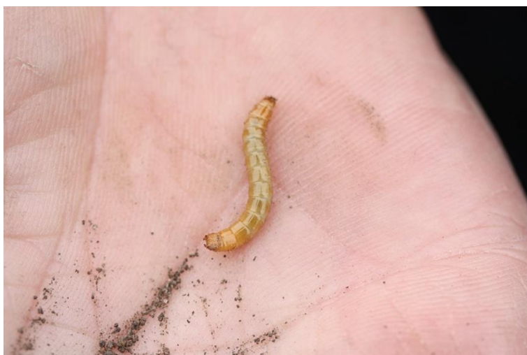
BILLEDE 13. SMELDERLARVE. FOTO: GHITA CORDSEN NIELSEN