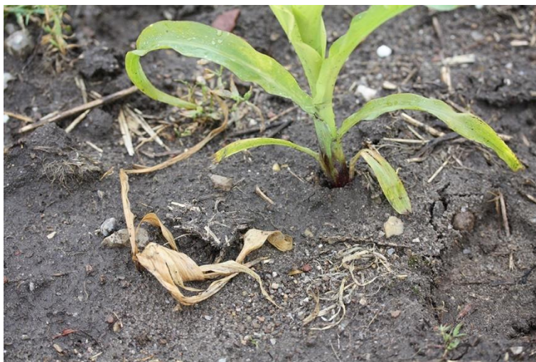
BILLEDE 12. MAJSPLANTE TIL VENSTRE, SOM ER ANGREBET AF SMELDERE.

Ved dyrkning af majs efter græs især flere års græs kan der derfor optræde angreb af smeldere. Alle afgrøder kan angribes af smeldere. Angreb er værst i tørre forår, fordi larverne her skal æde ekstra meget plantemateriale for at få fugtighed nok. Der er ingen muligheder for kemisk bekæmpelse i vækstsæsonen. Der findes bejdsemidler i udlandet med effekt mod smeldere. Forhør hos grovvarefirmaerne om det er muligt at bestille bejdset udsæd hjem af dyrkningsværdige sorter.