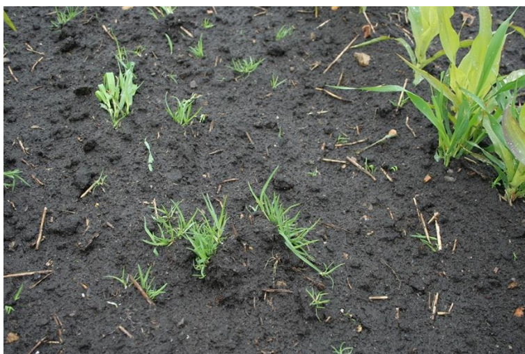
BILLEDE 4. HER HAR RADRENSEREN GÅET FOR DYBT, SÅ EFTERHARVEN IKKE HAR KUNNET 'SORTERE' UKRUDT OG JORD. TUER AF ENÅRIG RAPGRÆS HAR DERFOR ALT FOR GODE MULIGHEDER FOR AT VOKSE VIDERE.