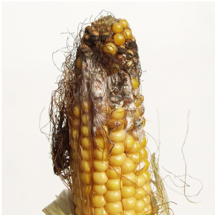
BILLEDE 6. SMITTEN MED FUSARIUM SKER OMKRING HUNPLANTENS BLOMSTRING (BLOMSTRER OMKRING 1.AUGUST), HVOR STØVFANG SKABER INDFALDSVEJ.

Indholdet af fusariumtoksiner i majs til halsæd i Danmark er oftest under de vejledende grænseværdier til kvæg.