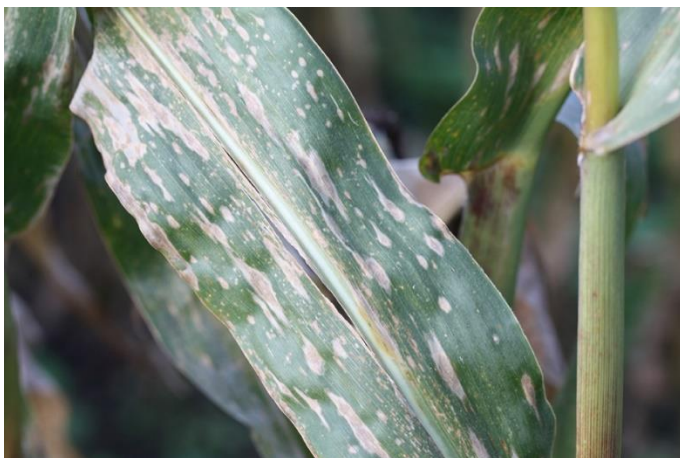
BILLEDE 10. MAJSBLADPLET. FARVEN PÅ BLADPLETTERNE KAN VARIERE FRA MØRKEBRUN TIL LYSEBRUN ELLER VÆRE MERE GRÅLIG.

Anvend med en konventionel sprøjte omkring 200-250 liter vand og brug f.eks. en 03 (blå) eller 04 (rød) lavdriftdyse.