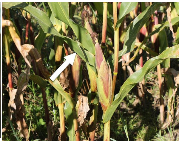
BILLEDE 11. I PLØJEDE MARKER ANBEFALES BEKÆMPELSE AF BLADSVAMPE, HVIS OVER 45 PROCENT AF PLANTERNE HAR ANGREB PÅ BLADET, DER STØTTER KOLBEN. BEKÆMPELSE KAN VÆRE AKTUEL INDTIL SPRØJTEFRISTEN, SOM ER BLOMSTRING (COMET PRO, OPERA) ELLER AFSLUTTET BLOMSTRING (PROPULSE).