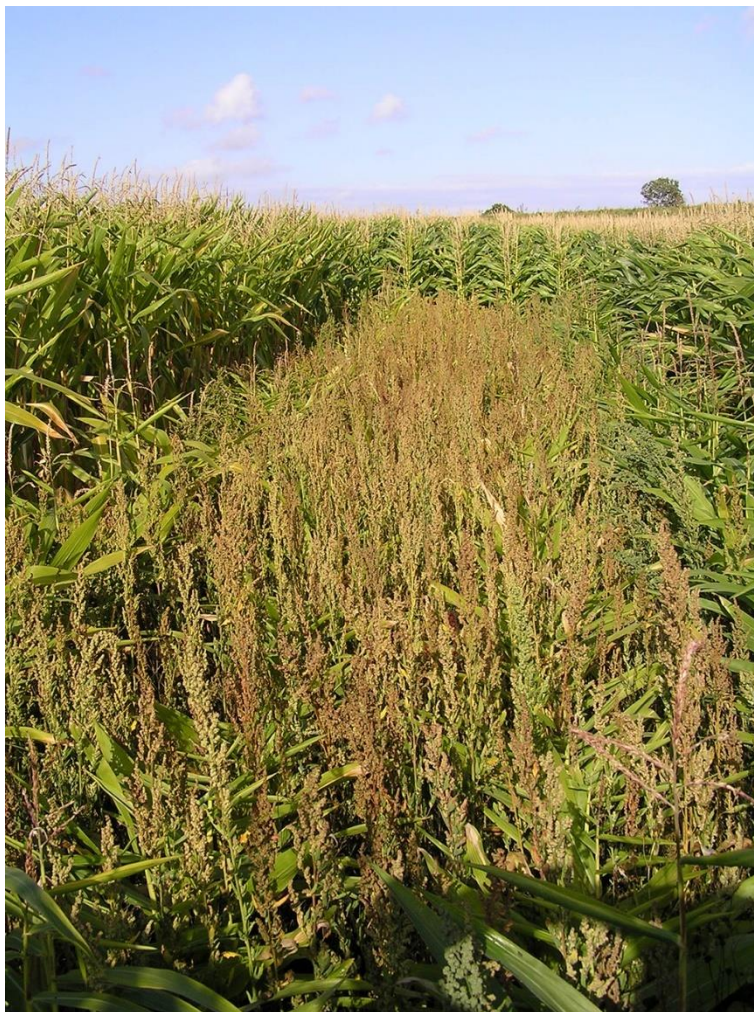
BILLEDE 2. MAJ HAR I STARTEN AF VÆKSTPERIODEN EN MEGET DÅRLIG KONKURRENCEEVNE OVERFOR UKRUDT. HER SES EN UBEHANDLET FORSØGSPARCEL.

Sprøjtninger bør som regel også gennemføres selv om majsens skulle være svækket af kulde. Hvis majsens imidlertid er såret som følge af vindslid eller sandflugt, afventes nogle dage til sårheling er sket, inden kemisk bekæmpelse foretages.