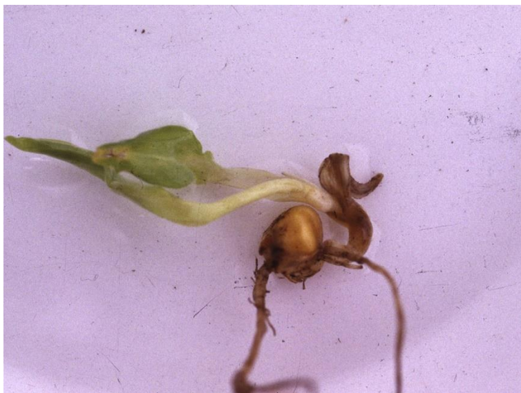
BILLEDE 5. SPIRINGSFUSARIOSE I MAJS. SPIREN KRØLLER OG LIGNER EN "PROPTRÆKKER".

Jo senere høst jo mere er planterne oftest angrebet af Fusarium.